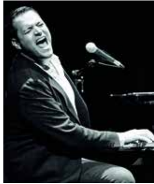
AUDITORIUM ALBERT LAURENT DU CONSERVATOIRE DE LA BAIE DE SOMME - RENS. : 03 22 24 41 28.

chansons sont empreintes de mélancolies et d'ondes positives. Les mots, taillés en toute simplicité, sont chantés sur des musiques tantôt groove et solaires qui collent à la peau.